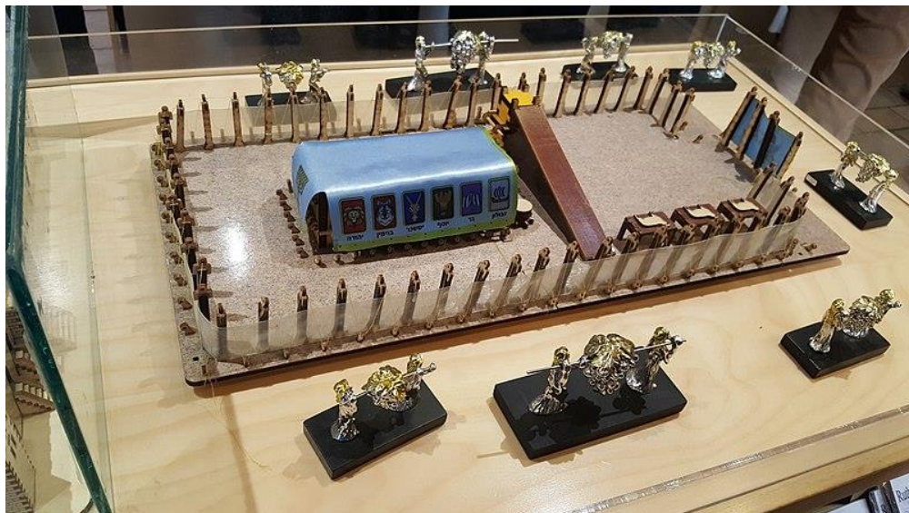
A Szent Sátor és udvarának makettja a silói múzeumban: