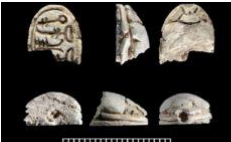
Háromezeréves, szkarabeusz alakú pecsétnyomó