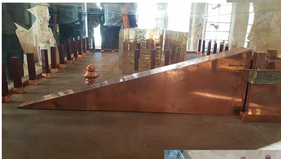
A sátorszentély idejéből származó leletek: